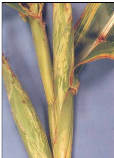
Figura. 3. Planta de maíz con síntoma de Corn Stunt Spiroplasma: Espigas múltiples y deformadas.

Corn plant with symptoms of Corn Stunt Spiroplasma: Shorted internodes and chlorotic bands in the leaf.