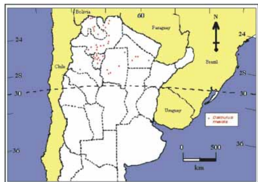
Figura 5. Detección de Dalbulus maidis desde la campaña 1991/1992 hasta 1999/2000.

Detection of Dalbulus maidis from 1991/1992 to 1999/2000 period.