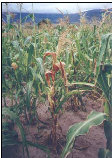
Figura. 1. Planta de maíz con síntoma de Corn Stunt Spiroplasma: Bordes foliares rojizos.

Entre las enfermedades más importantes que afectan la producción de maíz se encuentra el achaparramiento (Cervantes et al. , 1958) o "Corn Stunt Spiroplasma" causado por Spiroplasma kunkelii (Nault & Bradfute, 1979). Esta enfermedad fue citada por primera vez en Estados Unidos (Alstatt, 1945) y está presente principalmente en áreas tropicales o subtropicales del Continente Americano, México (Cervantes et al. , 1958), Nicaragua, El Salvador, Venezuela, Colombia y Honduras (Smith & Niederhauser, 1958) Perú (Castillo & Nault, 1982), Bolivia y Brasil (Costa et al. , 1971; Costa & Kitajima, 1973), Argentina (Lenardon