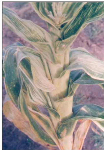
Figura. 2. Planta de maíz con síntoma de Corn Stunt Spiroplasma: Acortamiento de entrenudos y bandas cloróticas en hojas.

Corn plant with symptoms of Corn Stunt Spiroplasma: red leaf borders.