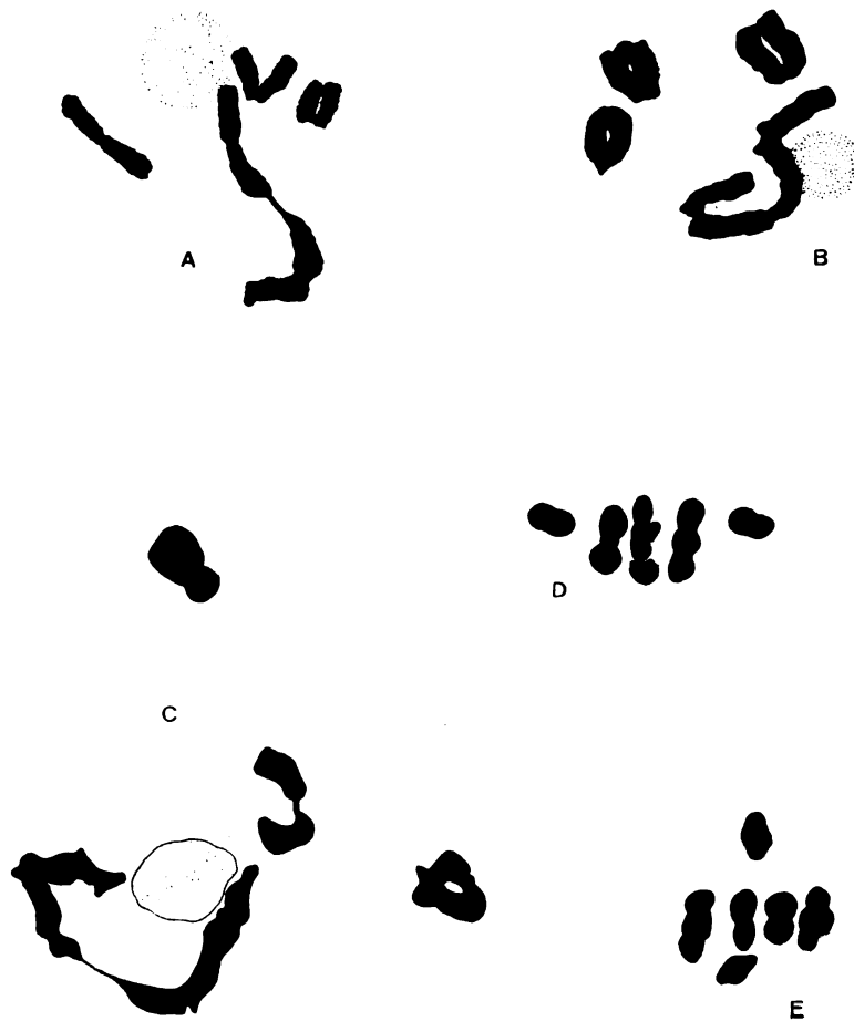
Fig. 1. — A, B y C, diacinesis en Glandularia stellaroides 55.5%, con formación de cadenas de cuatro cromosomas; D y E, metafase I en el mismo, con 4 II + 2 I. Todo \times 4.000

Las observaciones comprendieron los caracteres siguientes: asociaciones cromosómicas en diplotene-diacinesis y metafase I; distribuciones cromosómicas en metafase II; esporadas y granos de polen.