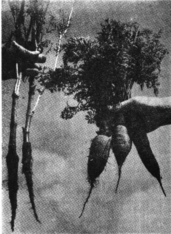
Fig. 1. — Raíces de plantas de zanahoria sembradas en el mes de julio de 1958 y cosechadas en diciembre del mismo año. Los dos ejemplares de la izquierda, de pésima calidad comercial, provienen de semilla de origen nacional; los tres de la derecha (comercialmente aptos) se originaron en semilla importada.

cultivadas más tarde en condiciones de alta temperatura, mientras que la exposición de plantitas jóvenes durante 30 días o más a una temperatura de 4,4 a 10°C indujo la floración si eran luego cultivadas bajo condiciones de día largo. Refiere que a baja tempera-