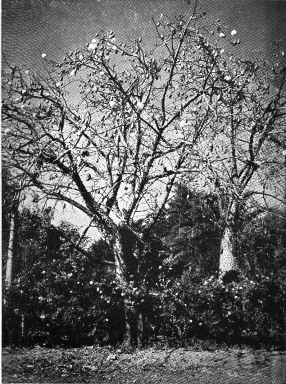
Ejemplares de « Palo borracho » ( Chorisia sp.) en la finca « Samay Huasi » (Chilecito, La Rioja). Casa de descanso para artistas, escritores y profesores de la Universidad Nacional de La Plata