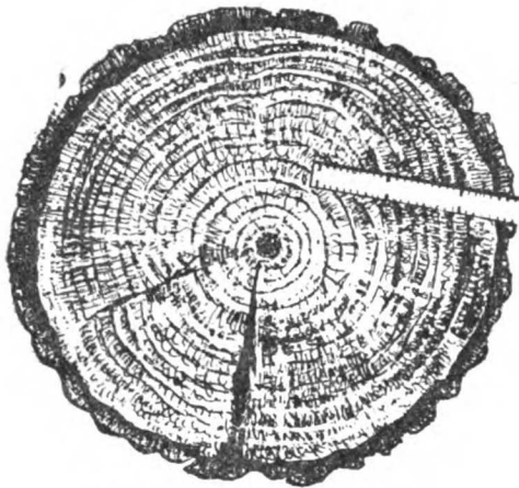
Disco de Pinus ponderosa . Anillos de crecimiento