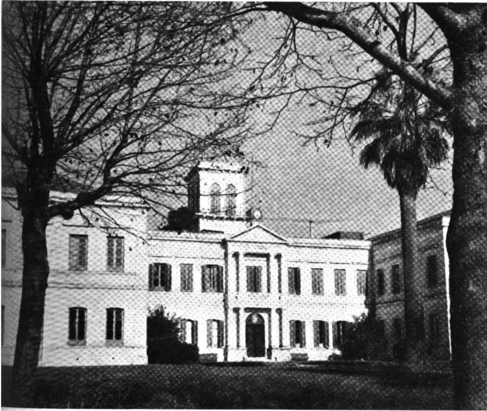
Pabellón principal del «Instituto Fitotécnico de Santa Catalina», Llavallol, provincia de Buenos Aires (Facultad de Agronomía, Universidad Nacional de La Plata)