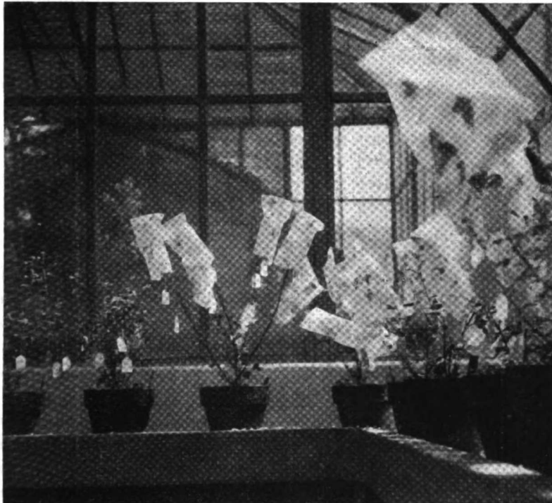
Fig. 2. — Fotografía que muestra parte del material utilizado en la investigación que se informa

dos individuos tomados al azar en una población originada por siembra de semillas recogidas en los alrededores de la ciudad de Mendoza. Los cruzamientos fueron realizados en invernáculo, aislándose las flores utilizadas mediante bolsitas de papel « glassine ». Las plantas se mantuvieron en macetas y en cada operación se realizaba el cruzamiento en ambos sentidos, poniendo en contacto anteras de una