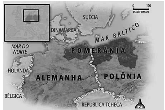
Figura 2. Mapa ilustrativo da antiga Pomerânia projetada no atual território da Alemanha e da Polônia. Fonte: Rev. Eletrônica Globo Rural (2008).

A área ocupada pelos pomeranos ampliou-se e novas colônias foram fundadas, com a chegada de novos colonos e migração de seus descendentes. Esse é o caso da colônia Py Crespo, situada no 3º Distrito de Pelotas, um dos locus de estudo desta pesquisa.