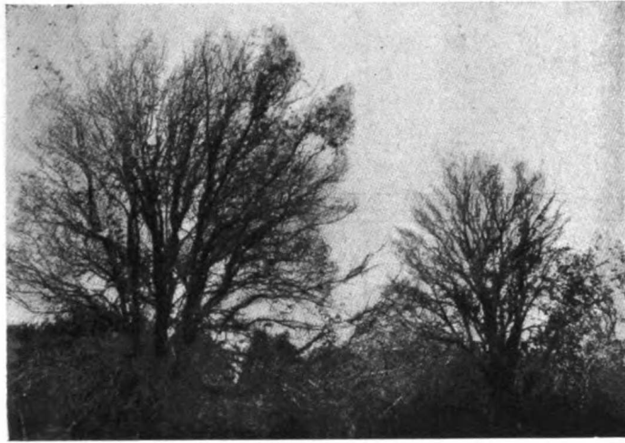
Fig. 3 Naranjos muertos por la "gomosis".