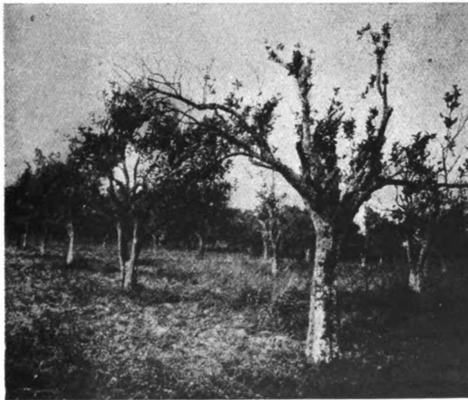
Fig. 2 Naranjos totalmente atacados por la "gomosis".