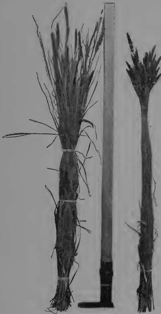
Figura 4. Manejo de heno y espigas de Phalaris bulbosa .