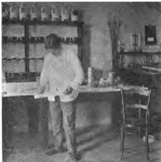
Fig. 2. Mezclando homogéneamente el total de la muestra.

capacidad de este tubo es de un litro exactamente. Para que todos los granos caigan en este tubo con la misma velocidad, se dispone de un disco de bronce D que debe colocarse sobre el cuchillo C previamente encastrado entre las ranuras que presenta el tubo en su parte superior; al caer el disco, cuyo diámetro es casi igual al del tubo, expulsa el aire existente en él por pequeños agujeros del fondo del tubo, produciéndose el vacío. El tubo sin fondo B sirve para la colocación del grano sobre el disco antes de la caída.