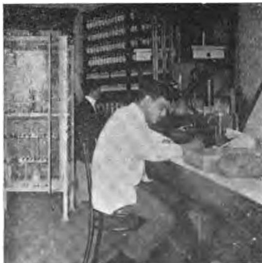
Fig. 7. Determinando el peso del hectólitro.

Se determina pues, la densidad de las semillas: 1° tomando un peso cualquiera de granos, 100 gramos, por ejemplo; 2° hallando el volumen de estos 100 gramos, que se obtiene de la siguiente manera: se toman dos probetas graduadas de 250 c. c. cada una; se llena una de ellas hasta la graduación 50, con agua destilada á la temperatura de 16 \frac{0}{c} y se llena completamente la otra con el mismo líquido. En la probeta que contiene 50 c. c. de agua destilada se echan los 100 gramos de semillas y se las moja perfecta-