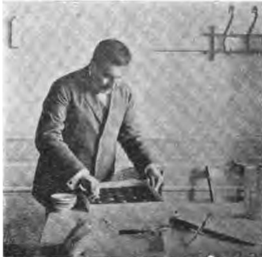
Fig. 3. Sacando el término medio de una muestra de semillas destinadas al análisis.

A este sistema pertenecen también la Balanza de cuadrante normal y á \frac{1}{4} litro y la Balanza del hectólitro de \frac{1}{4} litro , que no describimos en obsequio á la brevedad; se trata de pequeñas modificaciones simplemente.