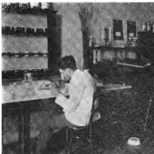
Fig. 5. Haciendo el análisis: separación de las semillas extrañas é impurezas.

Se toma el litro (1) y se lo llena del grano que se desea pesar. Se vacía el contenido sobre uno de los platillos de la balanza y se pesa. El peso obtenido es el de un litro de semillas; de manera que para saber el peso del hectólitro, no hay más que multiplicarlo por 100.