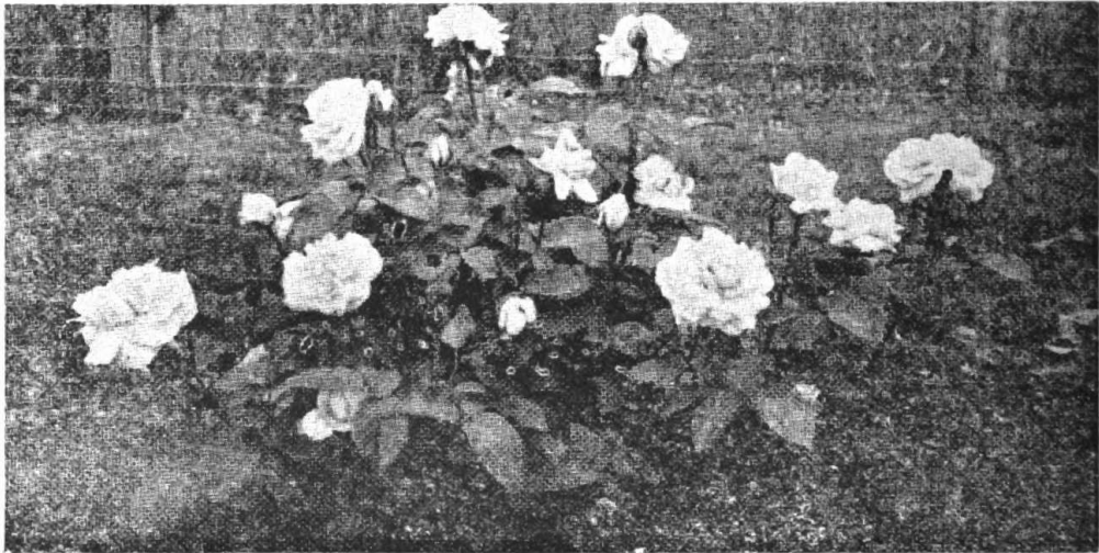
LA «MADAME GABRIEL LUIZET» ES ROSAL MUY ADECUADO PARA PRADOS SI SE LE CULTIVA COMO MATAS SOLITARIAS