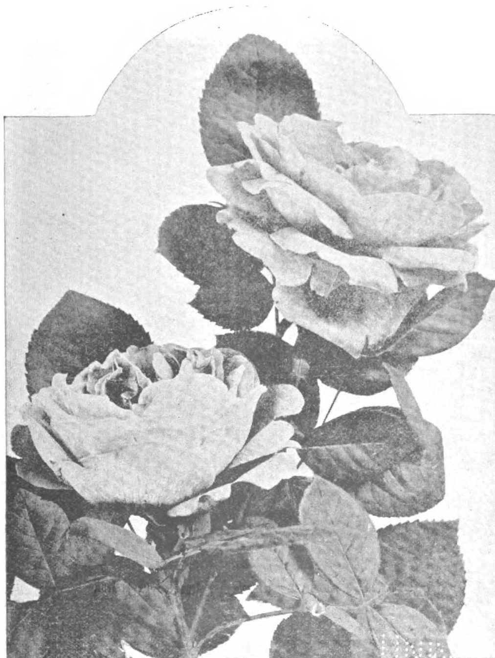
ROSAS «AMERICAN BEAUTY» LEVANTADAS Á CIELO ABIERTO, BAJO TEGUO DE VIDRIO Y CON CULTIVO INTENSIVO, LAS ROSAS SON MAS GRANDES Y APRETADAS