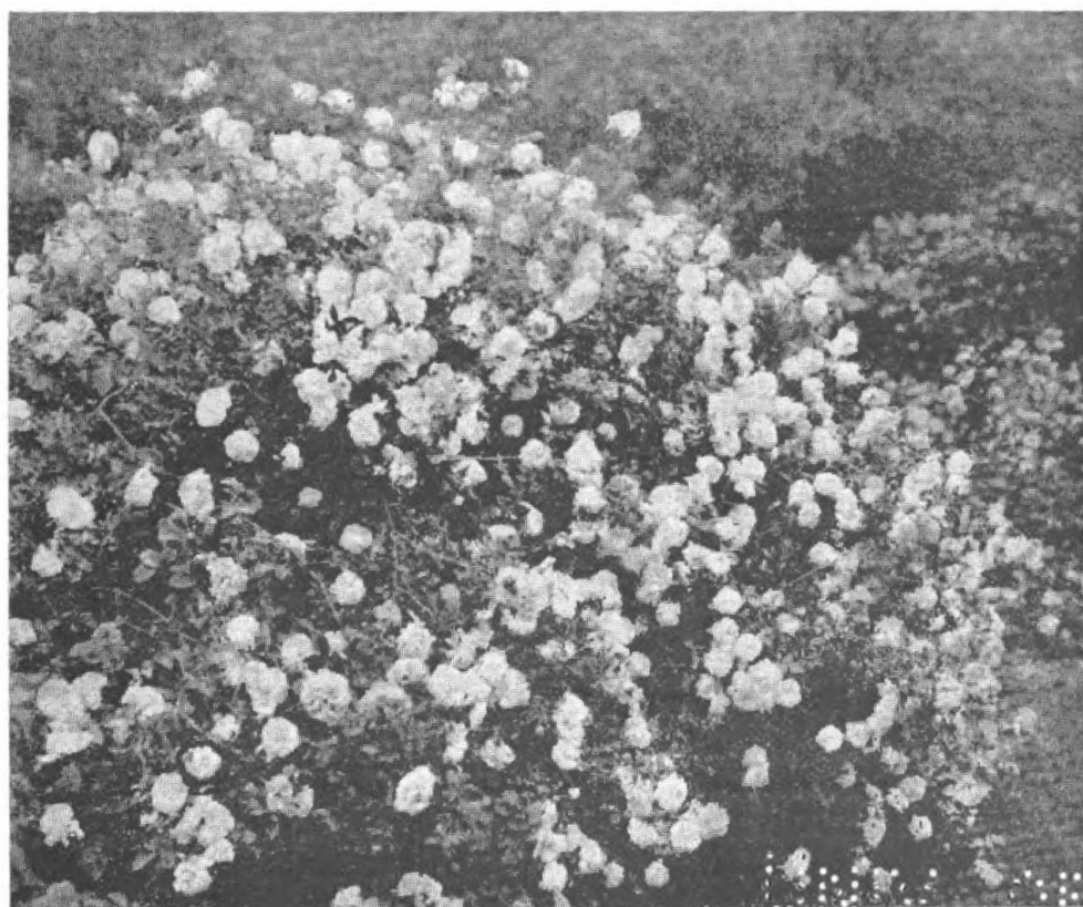
EL «MADAME PLANTIER», ROSAL MUY PROLIFICO Y PROPIO PARA VEGETAR Á LA DESCUBIERTA