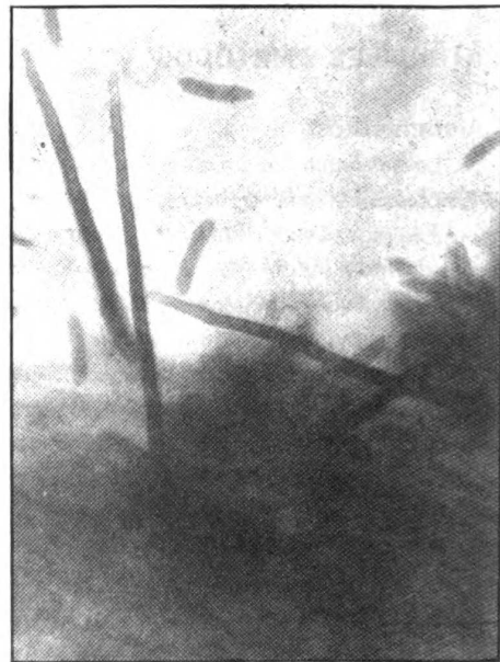
Figura 2. Setas típicas del género Colletotrichum . (400 X)

Las acérvulas midieron entre 28 y 62 µm de ancho y las setas de color castaño oscuro eran aguzadas en su extremo superior con 3 ó 4 tabiques y oscilaron entre 70 y 150 µm de longitud, sobrepasando generalmente la masa conídica (Fig 1 y 2).